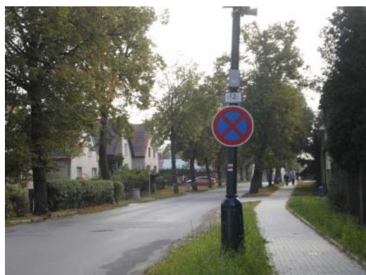
Foto č. 6: Prostor pro výsadby je i v úseku mezi ulicemi Jungmannova a B. Němcové nedostatečný. Zejména po pravé straně vozovky (ve směru od Husova náměstí), by ve velmi krátké době došlo k poškození výsadeb silným provozem.