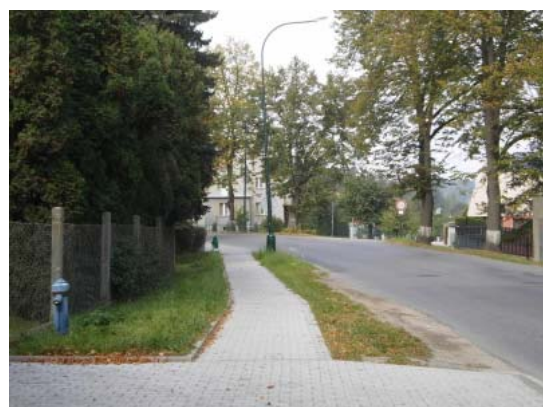
Foto č. 8: Úzký travnatý pás bohužel nedovoluje obnovit stromořadí jako oboustranné, z důvodu minimálního kořenového prostoru a velkého zatížení v zimním období, především solením.