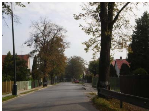
Foto č. 1, 2: Celkový pohled na dvouřadou alej Tilia cordata v ulici E. Beneše.

Cílem projektu sadových úprav je tudíž řešení rekonstrukce uličního stromořadí popřípadě doplnění vhodných keřových skupin. Důležitou součástí je zmapování ploch vhodných pro výsadbu stromového, či keřového patra.