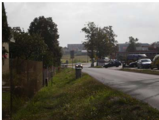
Foto č. 9: Pohled ke křižovatce se silnicí E 55, která rozděluje město na dvě části. Vpravo parkoviště u autoservisu.