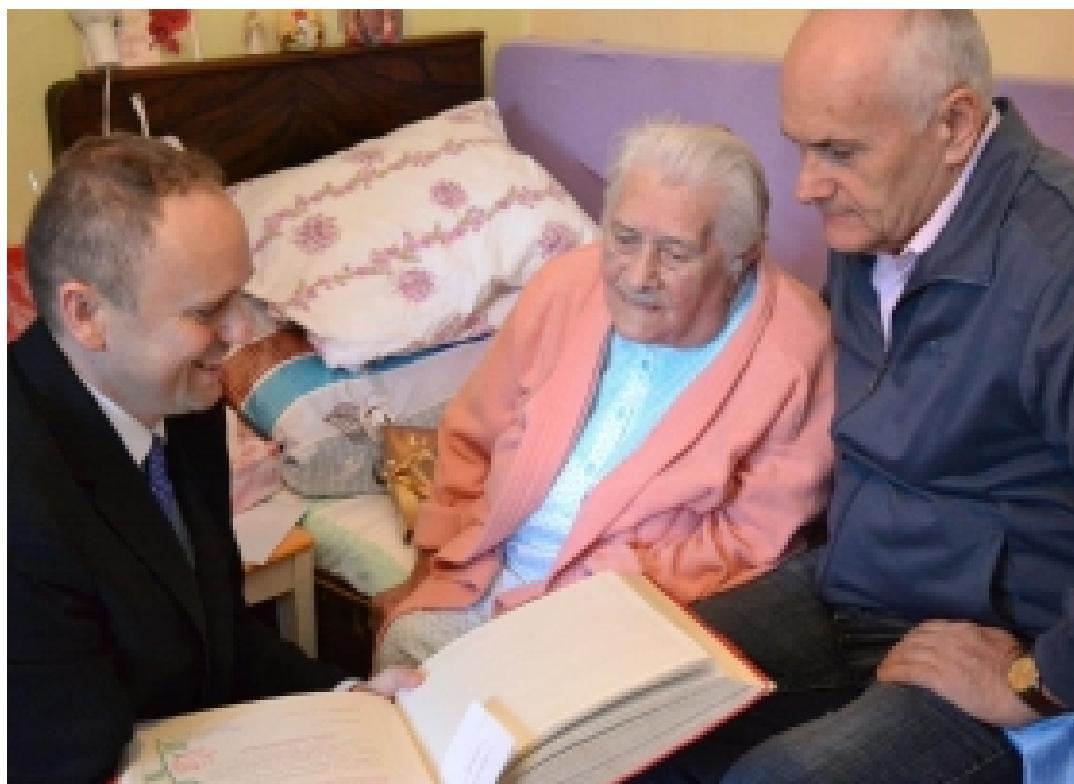
Zápis do pamětní knihy města Sezimovo Ústí