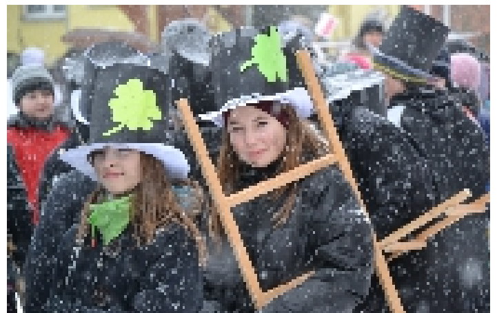
Foto: Kateřina Nimrichtrová - MěXus Více fotografií na www.kulturamexus.cz

PRŮVOD MASEK. Tradiční sezimácký masopust připadne letos na úterý 4. března. Průvod masek vyrazí v 10 hodin od Základní školy 9. května. Těšit se můžete opět na roztodivné maskary, které se ve finále předvedou s programem na náměstí T. Bati. Masopust pořádá MěXus ve spolupráci s místními školami.