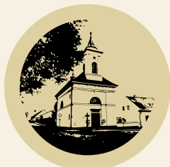
Empírový kostel Povýšení sv. Kříže na Husově náměstí