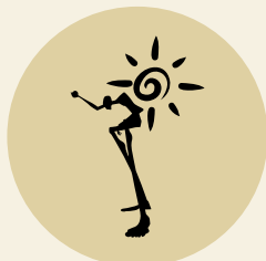
Sluneční hodiny na náměstí Tomáše Bati

Anketní lístek odstříhnete a křížkem označíte jeden z motivů. Lístek můžete odevzdat do 30. června 2017 buď do schránky MSKS, do schránky městského úřadu nebo v městských knihovnách Sezimovo Ústí.