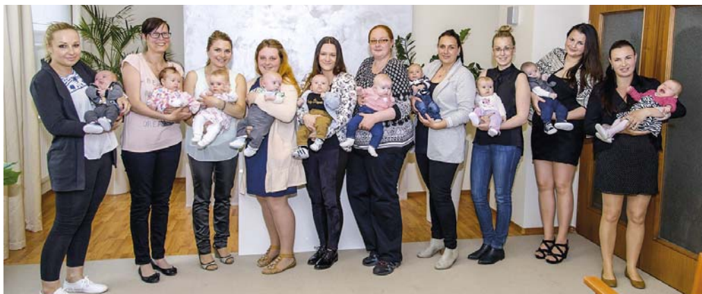
Dne 13. 5. 2017 v obřadní místnosti Městského úřadu Sezimovo Ústí přivítal starosta města a členky Sboru pro občanské záležitosti skoro 30 nových občánek našeho města. Všem děťátkům a jejich rodičům přejeme hodně zdraví, štěstí, lásky a radosti.