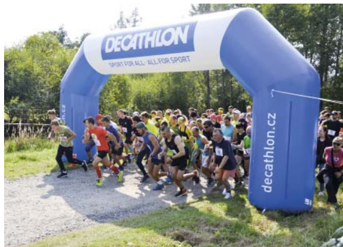
První ročník Sezi Runu se vydařil, odstartoval 9. září v 15 hodin od hájovny Nechyba a registrovaných běžců bylo 114.