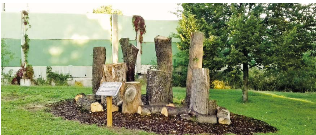
Broukoviště bylo vybudováno v parku (v bývalé tzv. Třešňovce) u železniční trati nad služebnou společnosti E.ON s.r.o.