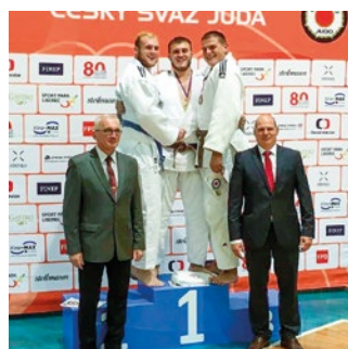
Fotografie z Mistrovství republiky v judu 2019

to na Mistrovství České republiky v kategorii juniorů, 2018 – 4. místo a v roce 2019 5. místo na Mistrovství České republiky v kategorii mužů. V lednu roku 2020 získal zlatou medaili v kategorii juniorů a stříbrnou v kategorii mužů na mezinárodním turnaji Danish open. Pravidelně vyhrává Český pohár v judu. V roce 2016 vyměnil TJ Sokol Tábor za klub Sport judo Litoměřice. Soutěží v kategorii +100 kg a pravidelně trénuje s mistrem světa Lukášem Krpálkem. Zápas proti Lukášovi v roce 2019 ve finále extraligy patří k jednomu