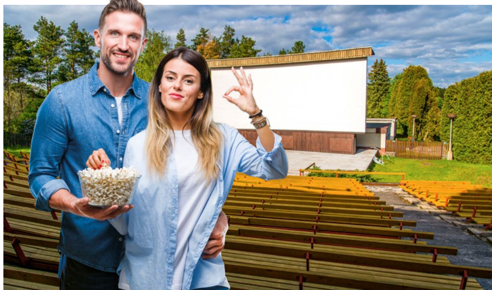
Letní kino zahajuje provoz již 5. června 2020.

Dokument z roku 1976 o kulturní a zájmové činnosti v Sezimově Ústí. V roce 1976 Československá televize odvysílala téměř hodinový snímek o lidech, kteří se tehdy věnovali kultuře a zájmové činnosti v Sezimově Ústí. Od té doby už pořad s názvem Neděle v klubu nebyl v televizi reprizován. Díky