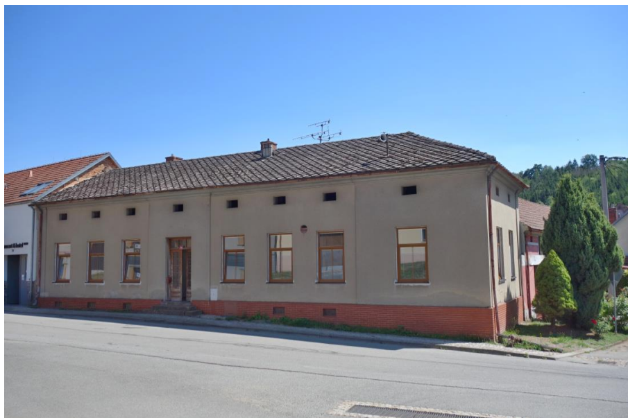
Příloha 2: Rodný dům Josefa Čupra – Býkovice 29