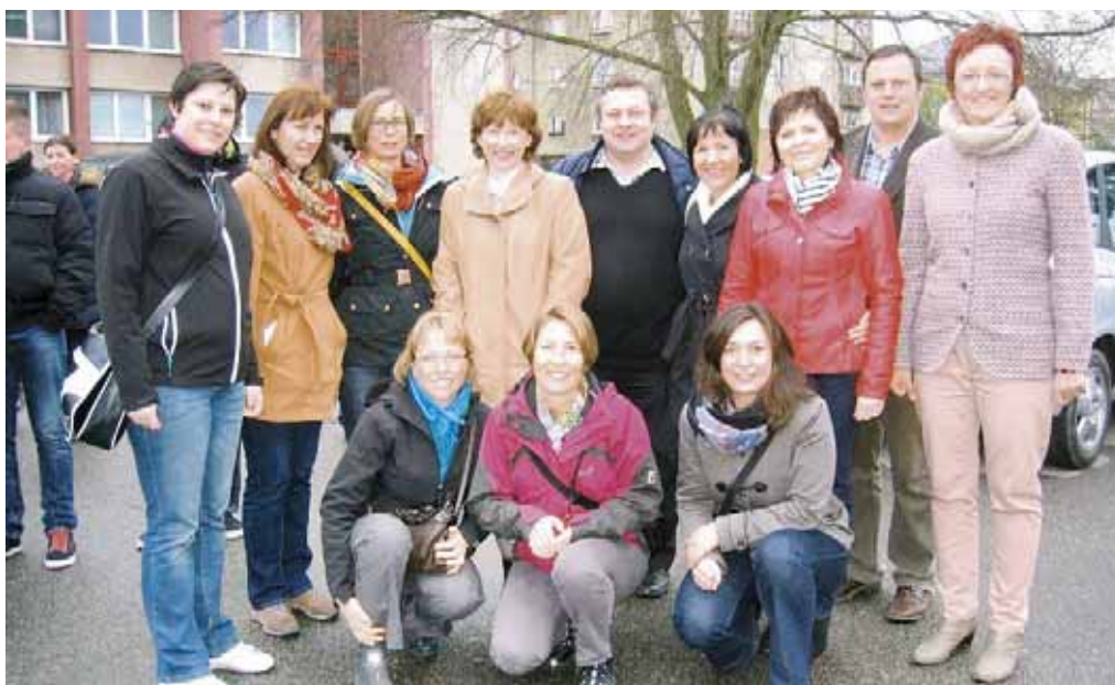
Pedagogové z Thierachernu se svými sezimoústěckými kolegy