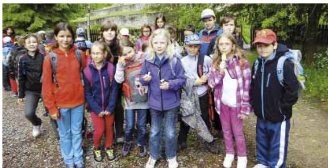
Na Den dětí dorazili žáci ZŠ Švehlova na Kozí hrádek. Po cestě na ně čekali ve formě záladných hádanek Ferda, Rumcajs, Sněhurka a kupa dalších pohádkových bytostí.

Kurzy se budou konat v klubovně Spektum od 30. 9. 2014, cena za 15 lekcí je 1650 Kč. Přihlášky pošlete prosím nejpozději do 20. září 2014 mailem na jazykovekurzy@centrum.cz, bližší informace dostanete na tel. č. 608 778 522. ■