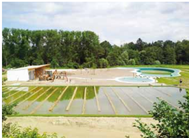
KOUPALIŠTĚ – Práce na stavbě sportovního rekreačního areálu s koupacím biotopem vrcholí.

Dovolujeme si v té souvislosti upozornit čestné dárcy krve, kteří mají trvalý pobyt v Sezimově Ústí a dosáhli stanoveného počtu bezplatných odběrů krve, že si mohou požádat o jednu z variant ocenění, a to do 30. 6. 2014 na telefon: 381 201 127 nebo e-mailem: j.blahova@sezimovo-usti.cz.