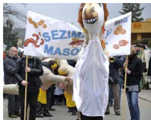
MASOPUST – Masopustní úterý letos vychází na 17. února. Průvod masek vyjde od ZŠ a MŠ 9. května v 10 hodin. Na náměstí se pak děti z místních škol a školek předvedou se svým programem.