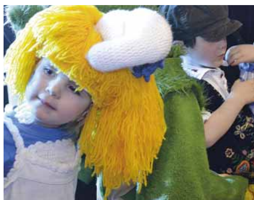
KARNEVAL – Tradiční dětský karneval v neděli 22. února bude opět v režii hudebního divadla Hnedle vedle.

Těšit se můžete na naživo zpívané písničky, hry, soutěže, tanec a samozřejmě soutěž o nejnápaditější masku. Začínáme v 15 hodin.