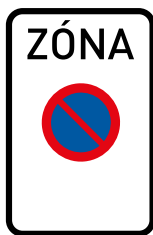
IP 25a Zóna s dopravním omezením

Vyzýváme majitele vozidel, aby dodržovali nařízení daná těmito značkami, v opačném případě může dojít k odtažení vozidla. ■