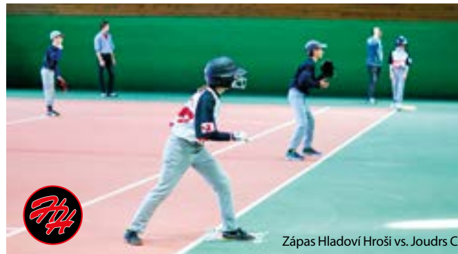
Zápas Hladoví Hroši vs. Joudrs C

Do tuhé, ale krátké zimě nevyběžají Hladoví Hroši z brlohu, ale po kvalitní přípravě pod střechem z hal a tělocvičen. Zimní příprava probíhala ve dvou fázích. Do konce roku se zaměřením na atletiku, gymnastiku a fyzickou kondici, od nového roku jsme přešli na cvičení s pálkou a rukavicí. Březen už je především o herní přípravě. V rámci halové sezóny jsme formou hostování absolvovali několik turnajů v kategorii kadetů a kadetek. V žákovské kategorii jsme pak v sobotu 4. 3. uspořádali už 3. ročník turnaje žáků HH CUP U13 MIX v tenisové hale U Cichů v Sezimově Ústí, hned vedle našeho hřiště. Do Sezimova Ústí se sjelo 8 týmů, které bojovaly ve dvou skupinách. Domácí tým, složený z osmi nováčků a doplněný třemi zkušenými hráči, narazil v prvním utkání na pražské Joudrs C. Po po-